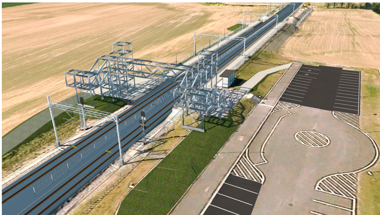
Figur 2: Utsnitt av 3D-modell for overgangsbro og plattformtilknytning. Sett fra sør mot nord.

De tre berørte planene varierer stort i omfang. Både områdeplan for Ler sentrum og reguleringsplan for E6 Røskaft-Skjerdingstad har et omfang som går langt ut over aktuelle arealer for planendring. For å gi en hensiktsmessig avgrensning av kartet som endres er det derfor tatt utgangspunkt i alle flater/formål som inneholder forslag til justeringer. Dersom det endrede formålet inneholder en smal stripe som endres e.l. er det i tillegg lagt til grunn å ha med ett formål på utsiden av det endrede formålet, slik at «klippelinjen» mellom endret del av plan og videreført plan blir helt entydig og ryddig. Dette gjør at man ikke får lange, smale slisser med endringer mot eksisterende plan, med lengre strekninger med justeringer av jernbaneformålet med utgangspunkt i nylig justerte eiendomsgrenser i matrikkelen.